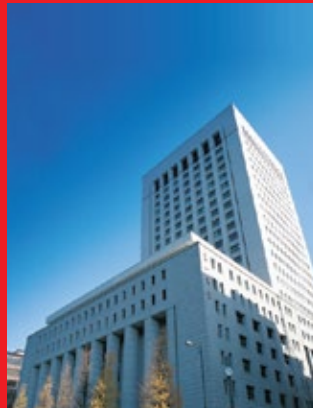
Tòa nhà trụ sở Dai-ichi Life Holdings tại Tokyo, Nhật Bản